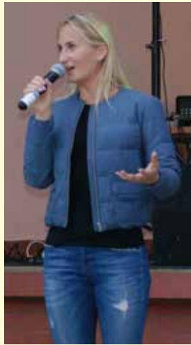
Na imprezie pojawiła się Natalia Madaj, polska wioślarka, Złota Medalistka Igrzysk Olimpijskich 2016 w Rio de Janeiro

Uroczystość rozpoczął rodzinny piknik, a czas uprzyjemniał przybyłym muzyczny zespół. Tuż po zmroku uczestnicy zabawy przeszli w korowodzie do Lubuskiego Centrum Winiarstwa. Nawiązując do winiarskich tradycji Zaboru i historii pałacu, przy największej lubuskiej winnicy odbył się krótki plenerowy spektakl, w którym o względy Bachusa ubiegały się dwie kobiety - winiarka i biała dama. Później w klimacie ciepłej, letniej nocy panny puszczały wianki na wodę. Kulminacyjnym punktem imprezy był pokaz sztucznych ogni. Obchody nocy świętojańskiej zakończyła dyskoteka.